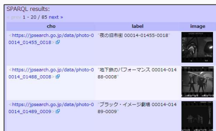
API（SPARQLエンドポイント）画面 ※ジャパンサーチ利活用スキーマ形式のデータを提供