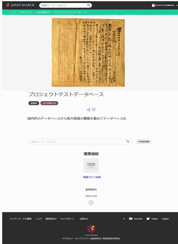
プロジェクトで作成したデータベース